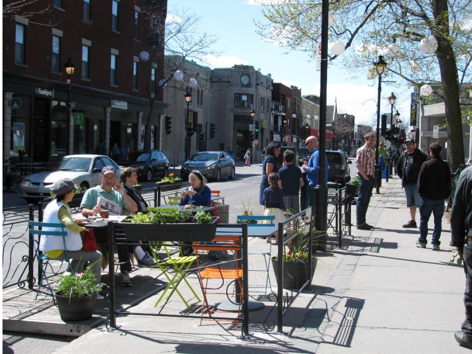
La terrasse L'entracte